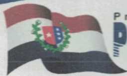
GABINETE DO PREFEITO TABELA C – FATORES CORRETIVOS DA EDIFICAÇÃO (CATEGORIA)